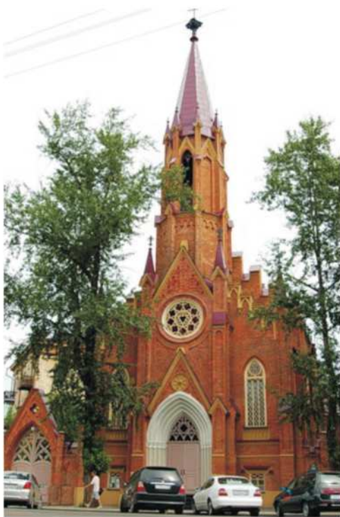
Taip dabar atrodo Dievo Motinos Dangun ėmimo bažnyčia.