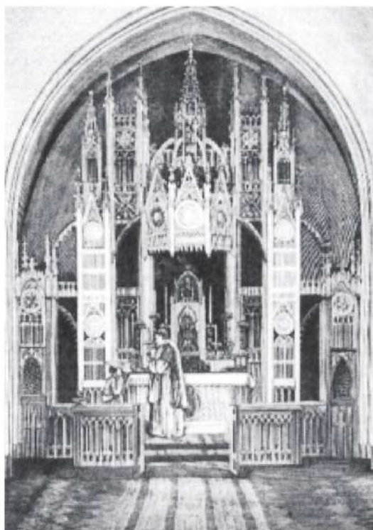
Medinis ažūrinis altorius, pastatytas 1868 m., architektas Valerijonas Kulikovskis., skulptorius Voicekas Koperskis iš Varšuvos.