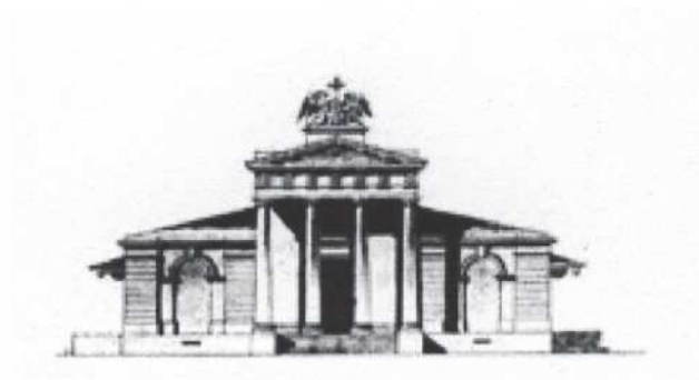
Irkutsko medinės Dievo Motinos Dangun ėmimo bažnyčios projektas. Pastatyta 1825 m., Švirmicko rekonstruota 1856 m., sudegė 1879 m.