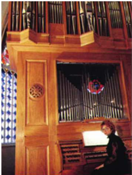
1978 m. perkonstruoti vargonai koncertams, (atliko Vokietijos firma „Aleksandr Šukė“).